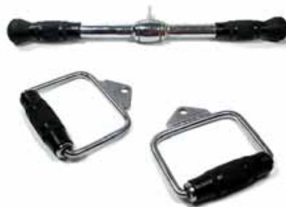
REVOLVI STRAIGHT BAR / Barra Corta per Tricipiti/Bicipiti cm 53 Cod. 9001