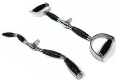
POR-STTLE LAT BAR / Barra con Impugnatura Parallela Stretta cm 60 Cod. 9006