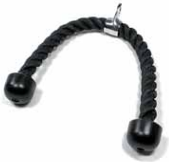
TRICEPS ROPE / Corda per Tricipiti cm 70 Cod. 9000