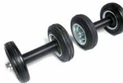
CORE WHEEL Coppia maniglie con ruote per esercizi di sliding. Partendo da posizione in ginocchio queste semplici maniglie dotate di ruote permettono un agevole allungamento in avanti. L'esercizio, con diverse variazioni, consente un ottimo allenamento dei muscoli addominali e della schiena, con un significativo impegno dei muscoli coinvolti nella stabilizzazione del "core": trasverso dell'addome, obliqui esterni, obliqui interni, retto addominale, quadrato dei lombi, dorsali, multifido. Per questa ragione l'attrezzo risulta particolarmente utile per la preparazione atletica e per il fitness funzionale.

Dimensioni: maniglia 12 cm; ruota 12,5 cm