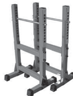
SQUAT RACK Si tratta di una coppia di robusti cavalletti regolabili in altezza per l'effettuazione di numerosi esercizi con bilanciere. Indispensabili per ragioni di sicurezza, risultano molto comodi e versatili perché separati. Possono, infatti, facilmente adattarsi alle più svariate esigenze ed essere altrettanto facilmente riposti, trasportati o utilizzati all'aperto.