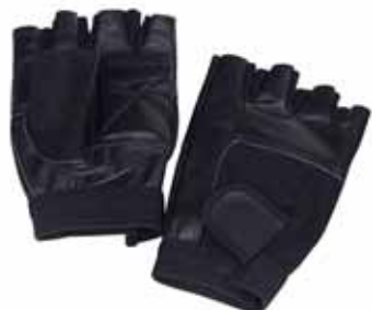
COPPIA GUANTO IN PELLE PER BODY BUILDING Coppia di guanti in pelle protettivi per esercizi di body building e sollevamento pesi. Prodotto dall'eccezionale rapporto qualità/prezzo, robusto ed ottimamente rifinito. Cod. 9022