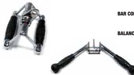
BAR COMBO / Triangolo per Pulley Cod. 9004