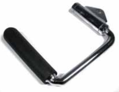
STIRUP CABLE HANDLE /Coppia Maniglia per Cavi Aperta Cod. 9002/1